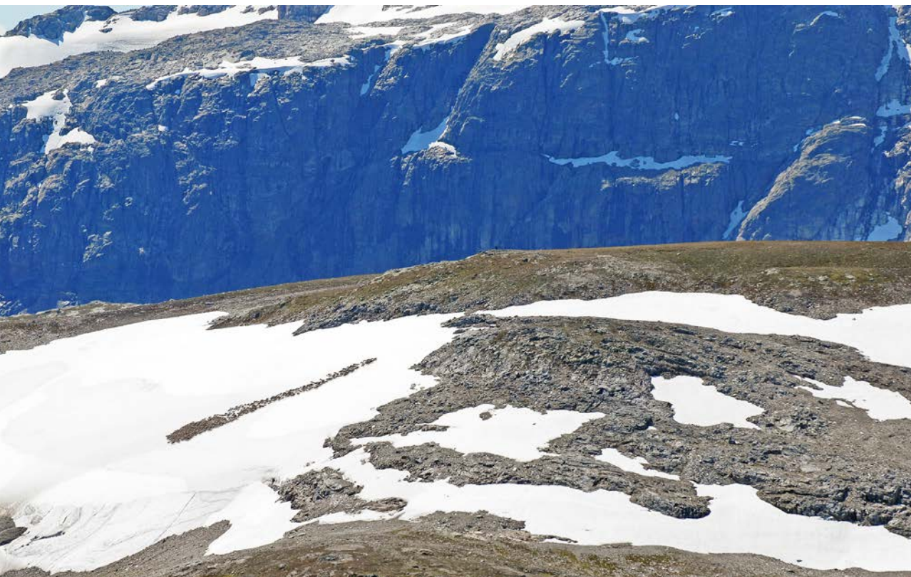
Renar söker sig gärna till snölegor för att minska insektsplågan.

Panzacchi m.fl. (2013 a) och Strand m.fl. (2015 b) har visat att markerade leder har haft betydande negativa effekter på vildrenens habitatanvändning i flera norska vildrensområden, både genom att djurens beteende förändrats och genom att stigar och vandringsleder hindrar renarna från att följa sina naturliga vandringsmönster. Det verkar också som om undvikandeffekterna beror på mängden mänsklig aktivitet (t.ex. Polfus m.fl. 2011; Helle m.fl. 2012; Strand m.fl. 2014; 2015 a, b; Colman m.fl. 2013; 2015; Eftestøl m.fl. 2016), så att ökad mänsklig aktivitet leder till större undvikandeffekter (Polfus m.fl. 2011; Panzacchi m.fl. in prep; Strand m.fl. 2014).