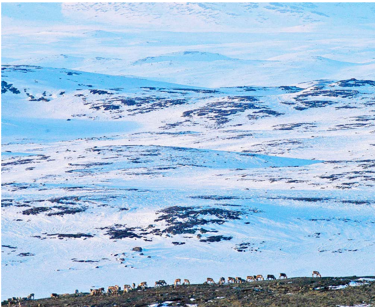
Vildrenar på vårfjället.

Vi vet idag att skala kan ha stor betydelse för resultaten i denna typ av studier. Därför anser vi att det är mycket viktigt att hänsyn tas till skala när framtida studier planeras och genomförs. Skala avser här både undersökningarnas längd och deras geografiska omfattning. Framtida studier bör i största möjliga mån försöka ta hänsyn till den samlade belastningen av all habitatanvändning i ett område. Kunskap som finns lokalt eller inom renskötseln har en viktig roll när sådana studier ska planeras och för att säkra att de har en skala som är relevant för de frågeställningar som ska besvaras och de beslut som ska fattas. I det sammanhanget är det viktigt att påpeka att regional skala i rummet också kräver lång utsträckning i tid, bland annat för att inkludera naturliga variationer mellan olika år. Man bör då eftersträva undersökningar som gör det möjligt att dokumentera habitatanvändningen i områdena innan vindkraftparkerna byggs, så att det finns ett tillräckligt bra dataunderlag för att belysa situationen före, under och efter uppförandet.