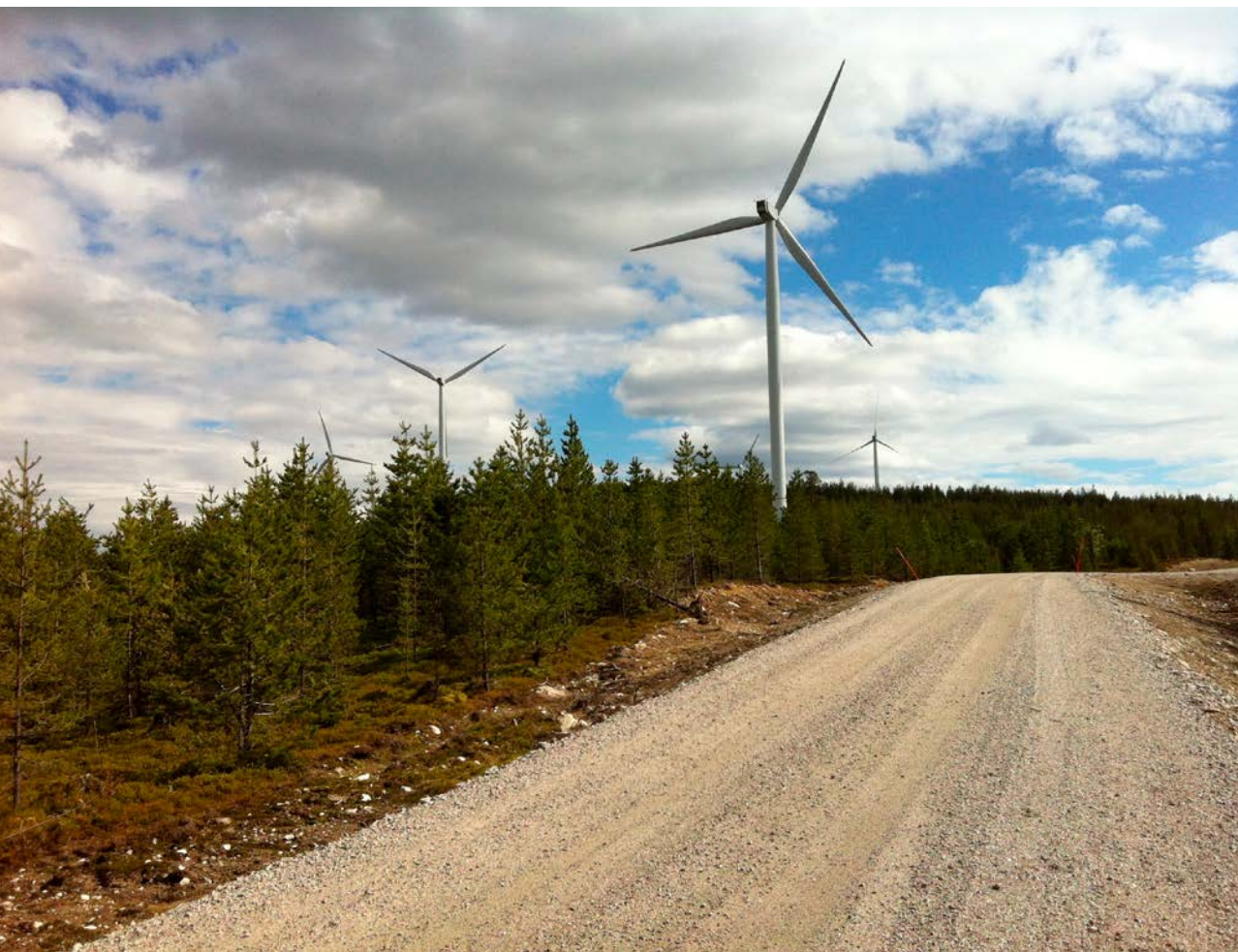
Storlidens vindkraftpark i Malå samebys kalvnings- och sommarbetesområde i skogen.

Respektive forskargrupp har ansvarat för presentationen av de olika resultaten i kapitel 3: Skarin m.fl. ansvarar för studie 1–3, medan Colman och Eftestøl m.fl. ansvarar för studie 4–11 i tabell 1 (samma numrering som i kap. 2).