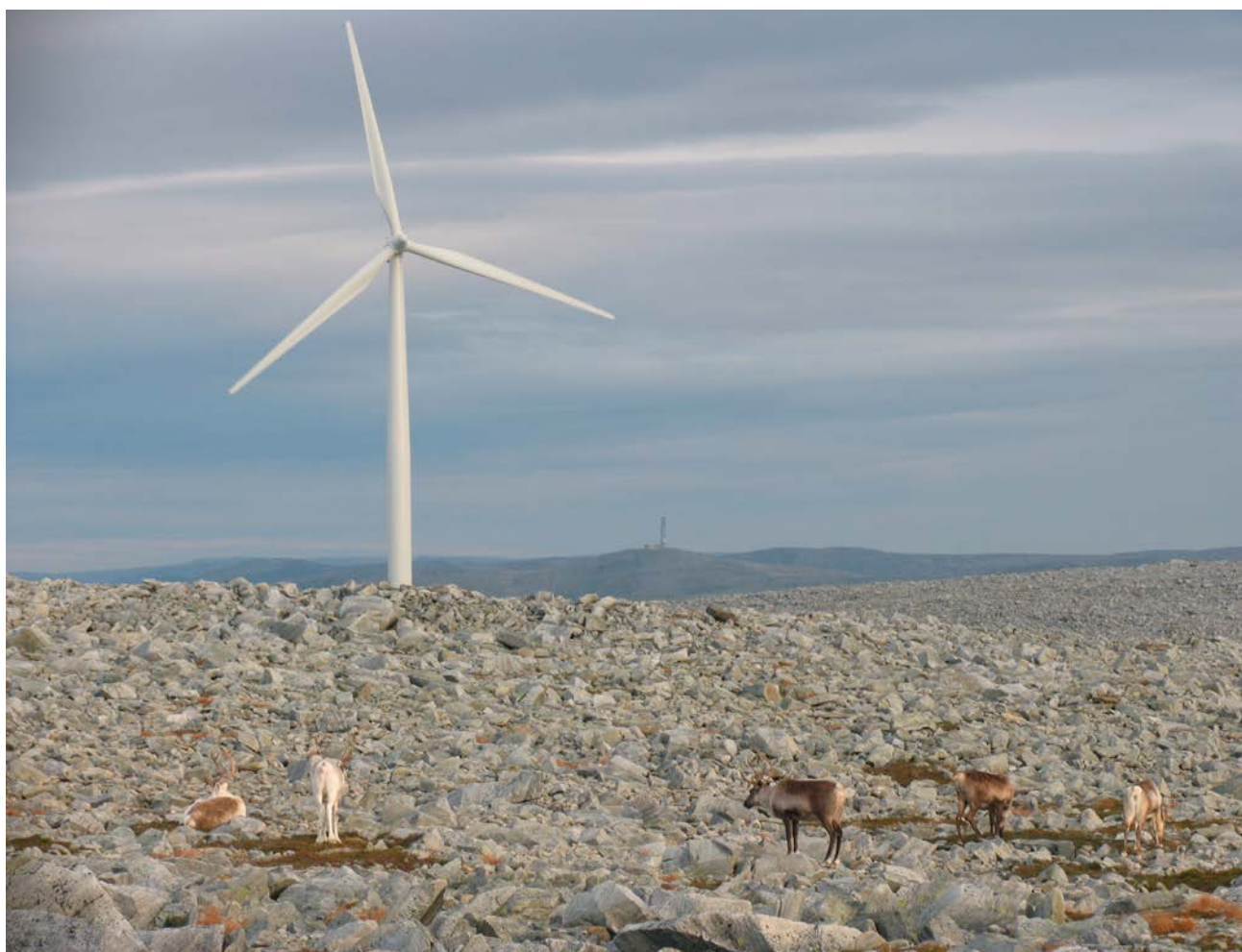
Tamren i Kjøllefjord vindkraftpark.

Registrering av renarnas betesbeteende gjordes för att testa hypotesen om byggande eller drift av vindkraftparken skulle göra renarna stressade och oroliga, vilket skulle registrerats som en ökad stegfrekvens vid betning (Colman m.fl. 2014). Dessa undersökningar gjordes under de fältperioder som angetts ovan. När en betande renhjord lokaliserats intog observatören en position som gjorde det möjligt att ha hjorden under kontinuerlig uppsikt utan att skapa störningar. En ren valdes ut slumpvis och följdes konstant under två minuter. Antalet steg för den individen räknades för att få ett mått på stegfrekvens. Flera olika renar från samma hjord kunde registreras. Man observerade hjordar som befann sig på olika platser på de båda halvöarna för att få ett mått på om betesbeteendet skulle påverkas av närhet till störningar som hängde samman med vindkraftparken eller andra mänskliga ingrepp. Studien har ett år med fördata i form av spillningsinventeringar från 2005, vilka visar habitat användningen under sommaren 2005 och troligen också tidigare somrar (Skarin 2008). Vidare gjordes de direkta observationer där antal renar räknades. Det samlades in data ett år från byggfasen och fyra års data från driftsfasen.