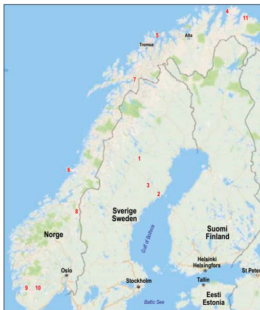
Figur 2. Geografisk översikt över de studier av vindkraftverks påverkan på tamren som återges i denna rapport. 1. Storliden och Jokkmokksliden, 2. Gabrielsberget, 3. Stor-Rotliden, 4. Kjøllefjord, 5. Fakken, 6. Vikna, 7. Nygårdsfjellet, 8. Essand, 9. Setesdalen vest, 10. Setesdalen aust, 11. Varangerhalvön Raggovidda. Se även tabell 1.

Kalvnings- och sommarbetesområdena i Malå sameby ligger i barrskogsområden. Området kring Storliden och Jokkmokksliden kännetecknas av en kuperad skogsterräng med sjöar, myrområden och skogar som viktiga landskapselement. Området präglas av tidigare skogsbruk, gruvarbete och annan markanvändning. Vägar delar in området i tre sektioner. Den östra och västra delen skiljs åt av vägar och flera byar norr om Mörttjärn. Det östra området delas i en nordlig och en sydlig del av vägen mellan Östra Lainejaure och Grundträsk. Här finns också en 40 kV kraftledning som går i öst-västlig riktning genom hela studieområdet. Topografiskt bidrar de