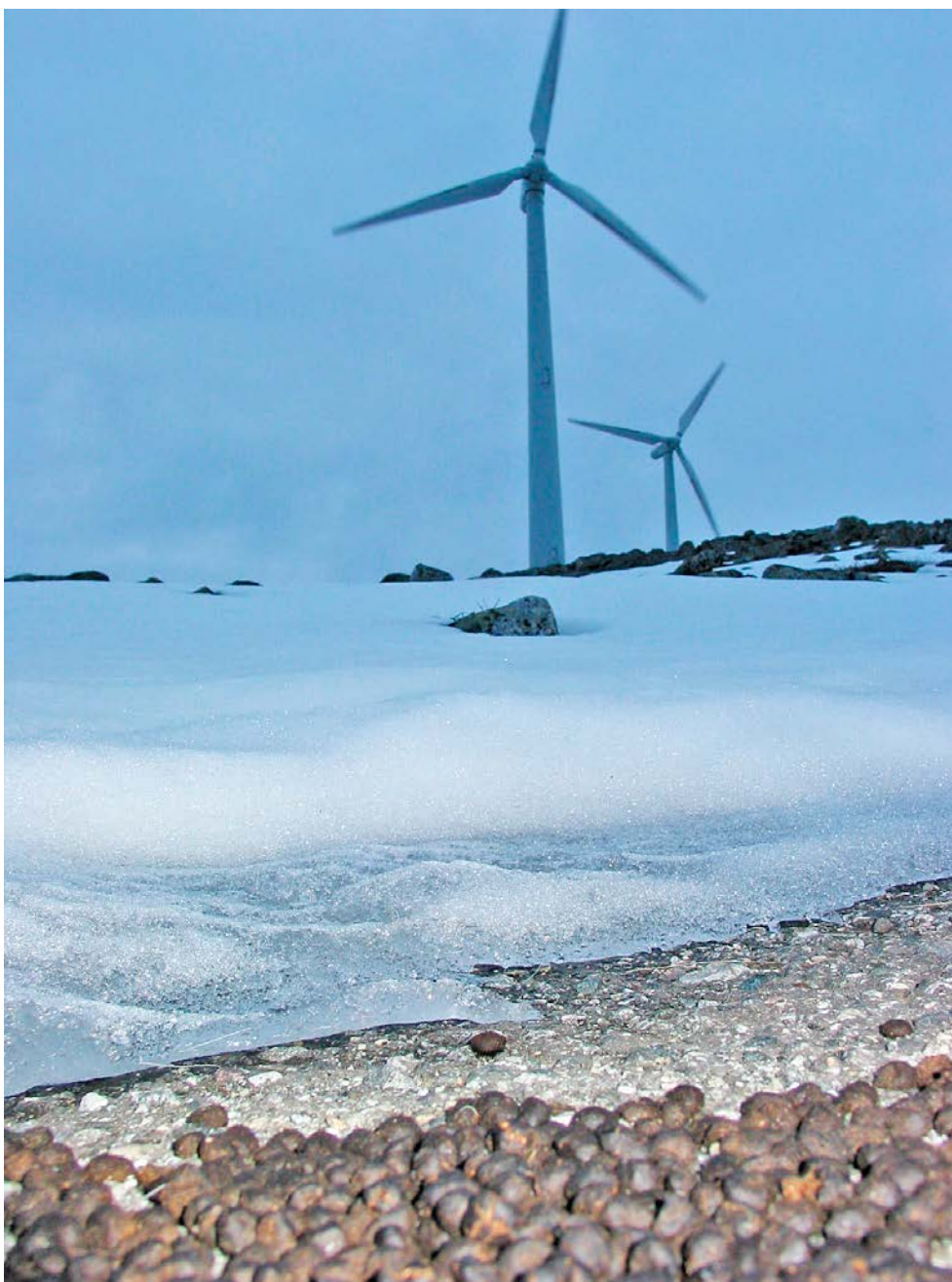
Renspillning i vindkraftpark.

I dessa har man två parallella studieområden – ett där utbyggnaden ska göras och ett (eller flera) som används som referens- och kontrollområden. Då går det att kontrollera för variationer mellan år och eventuella skillnader i beteende under tiden innan ingreppet gjordes. I sådana undersökningar av renar kan det vara problematiskt att finna/definiera användbara kontrollområden, eftersom renar rör sig över mycket stora och heterogena områden (Skarin & Åhman 2014). Det kan exempelvis vara svårt att jämföra två kalvningsområden på grund av variationer i landskapets förutsättningar (naturliga eller