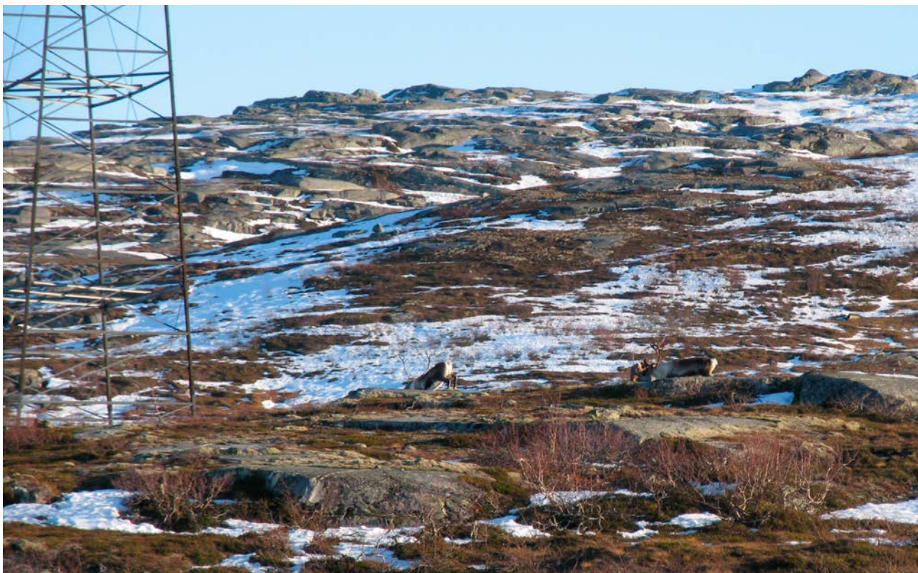
Renar under kraftledning.

Undersökningarna här började hösten 2011 och inleddes därför att Varanger Kraft planerade att bygga en vindkraftpark på Raggovidda, rakt sydost om Berlevåg. Områdena berör barmarksbeten i renbetesdistrikt 7, Riggonjårga, och projektet genomfördes i samarbete med distriktet. Undersökningarna har varit en del av VindRein/Kraftreinprojektet och ska bidra till kunskap om hur byggandet av vindkraftparker påverkar renarnas habitat användning. Renarnas habitat användning undersöktes innan utbyggnaden började, under byggfasen och i driftsfasen med hjälp av både GPS-märkning av renar och spillningsinventering i test- och kontrollområden. Byggandet började i juni 2013 och avslutades i september 2014. Från detta studieområde finns nästan två år med data från innan byggarbetena började, och drygt ett år med data från både bygg- och driftsfasen. Projektet har avrapporterats, men undersökningarna här ska fortsätta att samla mer data för att utöka kunskapen om hur renarna använder området i driftsfasen.