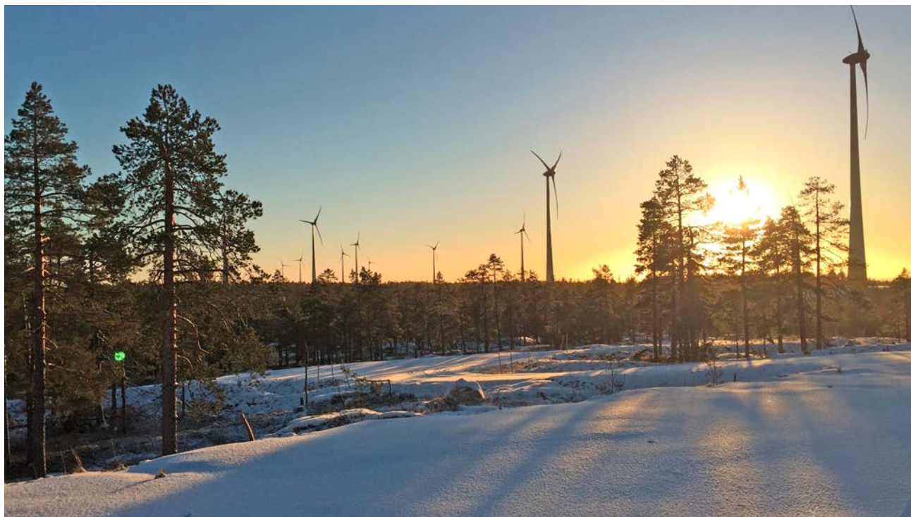
Gabrielsbergets vindkraftpark i Lögdeå konventionsområde i Vilhelmina norra samebys vinterbetesområde.

I Byrkije renbetesdistrikt märktes renar med GPS-sändare (Telespor AS, Tromsø) vintrarna 2013 (vintersäsongen 2012–2013), 2014 och 2015. Datainsamlingen började varje år när renarna släpptes på vinterbete efter att ha transporterats dit med lastbil, och avslutades när djuren samlades för transport tillbaka till Norge på våren. I analyserna användes data från sändare som hade registrerat minst en position/dygn. Totalt användes data från 41 renar under perioden 2013–2015. Inga data från perioder då djuren var samlade och utfodrades i beteshage användes i analysen.