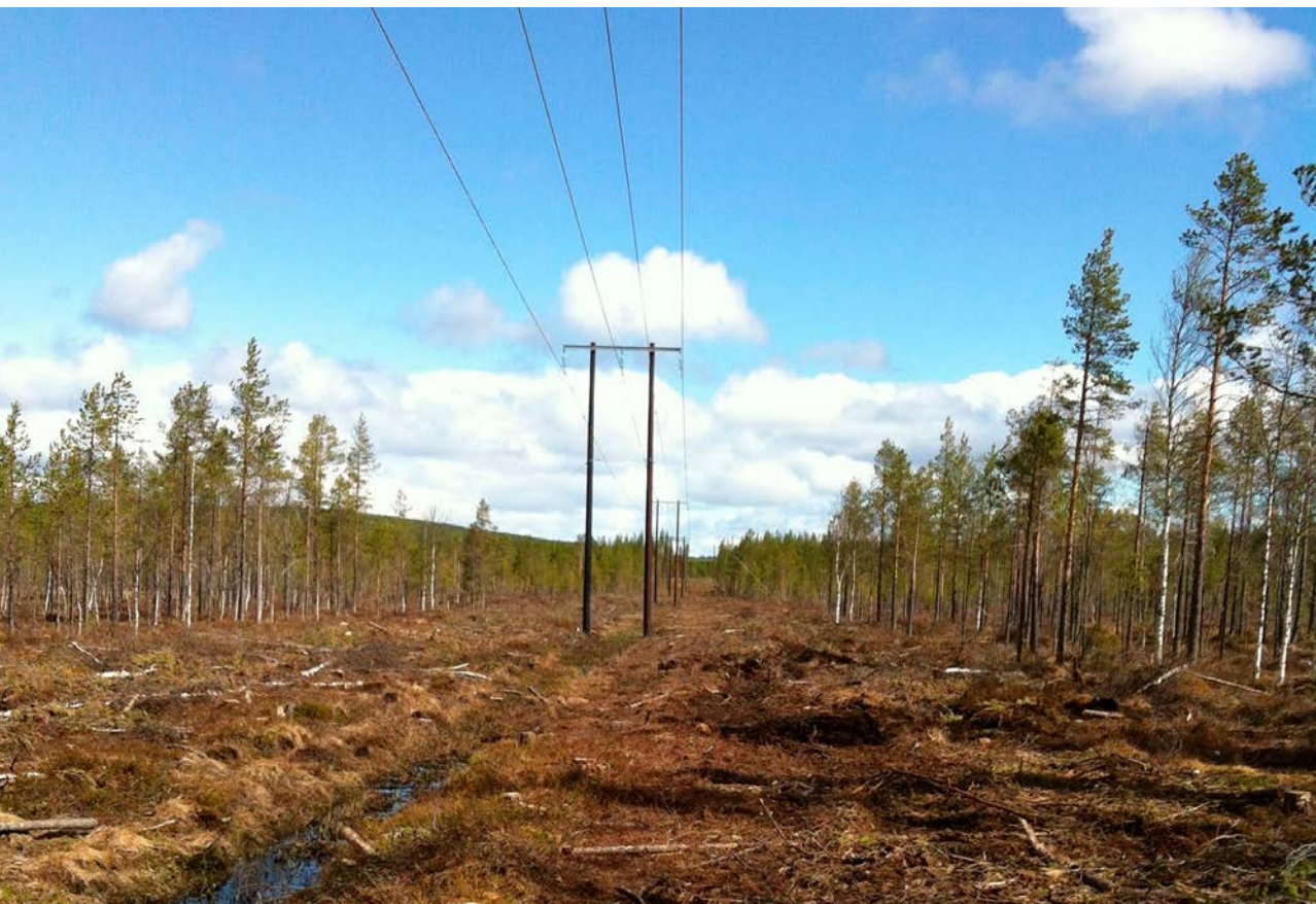
Kraftledning upp till Storlidens vindkraftverk i Malå samebys sommarbetesområde.

Skarin m.fl. (2016) undersökte effekterna av vindkraftparken genom att studera renarnas habitatutnyttjande i området. För att dokumentera utnyttjandet försågs 57 renar (5–15 renar per år) med GPS-sändare under perioden 2008 till 2011 samt 2015. Dessutom genomfördes spillningsinventeringar under åren 2009–2015. Spillningsinventeringarna genomfördes i ett område på 300 km 2 och data registrerades på både lokal och regional nivå. På den lokala nivån lades provtytor ut närmare varandra i de områden där vindkraftparkerna byggdes. Provytorna lades ut glesare i de större områdena som låg långt från vindkraftparken och omfattade både vindkraftparkerna och områdena inom 10–15 km avstånd från parkerna (figur 2). Totalt registrerades, märktes och inventerades årligen mellan 1 148 och 1 314 provtytor mellan den 23 maj och den 8 juni.